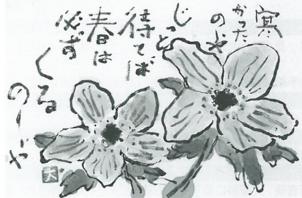
平成23年 山野草絵手紙コンテスト 優秀賞 藤江 建一さん

NPO法人節分草保存会が種子から育てた節分草を数量限定販売(1鉢1,500円) 日時●公開期間中 ※一日の販売数が限られるため、売り切れとなる場合があります ※売上げは節分草保存活動に使わせていただきます